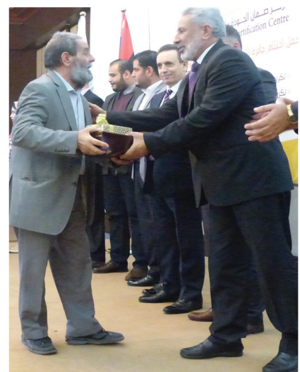
تكريم موظف بالمركز